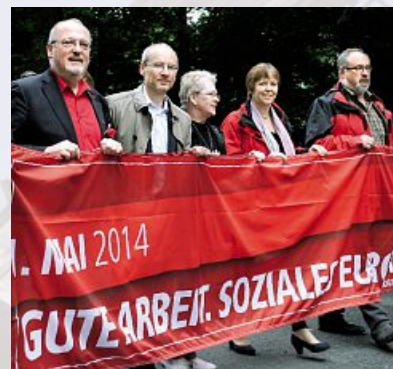
Gute Arbeit – der 1. Mai im letzten Jahr

Am 5. September findet unsere diesjährige Jubilarfeier um