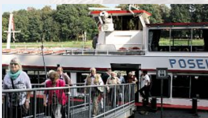
Von Bord: Der Jubilartag 2014 geht zu Ende.

Alle Termine im Internet unter ▶ minden.igmetall.de